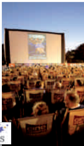
Célestine Baudouin © 2007