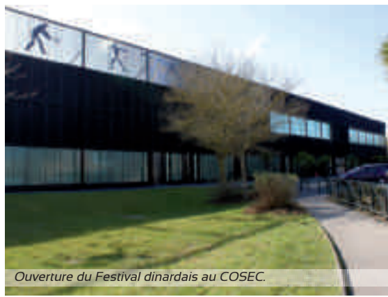
Ouverture du Festival dinardais au COSEC.

A foretaste of the Festival. From Sunday 3rd until Wednesday 6th Oct., enjoy recent British films for free. For the first time, the official opening will take place at the COSEC, on Sunday, Oct. 3rd at 5.30 pm : free screening of Danny Boyle's hit Slumdog Millionaire, followed by a cocktail. Numerous prizes and 2 Alizés cinema tickets to win ! (COSEC, Boulevard Gouyon-Matignon à Dinard). From Monday 4th until Wednesday 6th, screening will take place at the Palais des Arts, Stephan Bouttet theatre and 2 Alizés cinema.